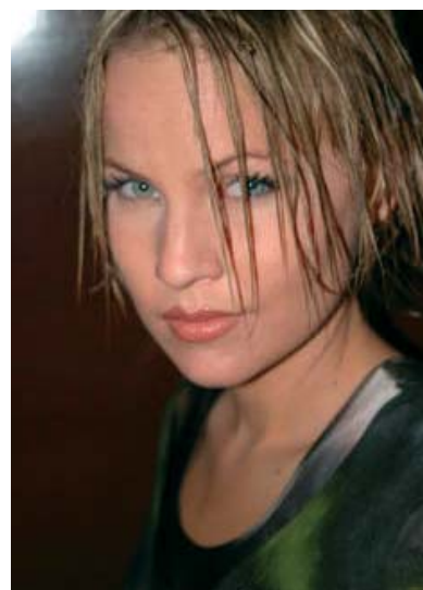
Concierto del CFG, el 3 de junio