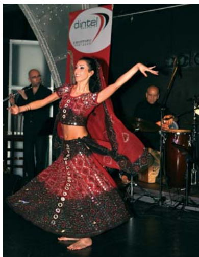
DINTEL Security Night del 17 de abril

“ S i no sabes torear pa'que te metes ”. Pues eso, que con esta segunda parte de entrevistas me “corto la coleta” y, a partir de este número de junio, la sección de jazz de a+ seguirá quedando exclusivamente escrita por