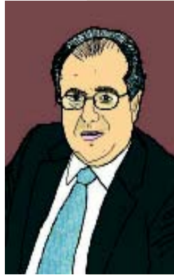
by Guillermo Searie Hernández

Pues mire, yo prefiero readaptar la célebre afirmación por todos conocida, en los siguientes términos: «lo malo, si breve, varias veces menos malo». Por supuesto, inmediatamente les añadiría: «lo largo, si equilibrado, siete veces bueno»... y les explicaré porqué. Desde mi puente de mando, como Editor de a+ , puedo asegurarles que utilizo este particular astrolabio; en la tarta adjunta les resumo algunas cifras significativas que aporté en el KICK-OFF .