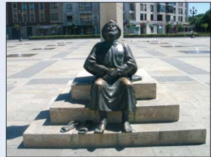
Monumento al Peregrino, frente al Parador

A 43 Kms. al norte de León, Torío arriba, se encuentran las Hoces de Vegacervera –estrecho y largo desfiladero– un tajo labrado por el río en la roca caliza. Allí, el Sistema Valporquero tiene tres entradas. Una, para el turismo, con 1.300 mts. de recorrido, abierta sólo en primavera y verano, con morfología cárstica en