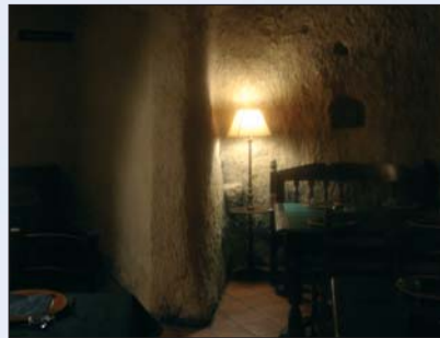
Interior Cueva Miñambres

No en vano, la zona leonesa es, sobre todo, “río”; Bernesga y Torío, al norte; Porma y Esla al este; y, ¡el Órbigo! al oeste. Paisaje e historia en sus orillas: – robles, escobas, urces, zarzas y