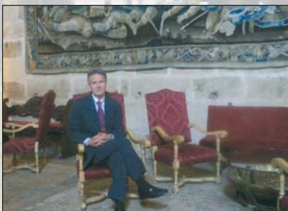
Director del Parador

A principios del siglo XVI el viejo edificio medieval es derruido y en su lugar, Fernando el Católico encarga un nuevo complejo conventual a don Pedro de Larrea; la obra fue llevada a