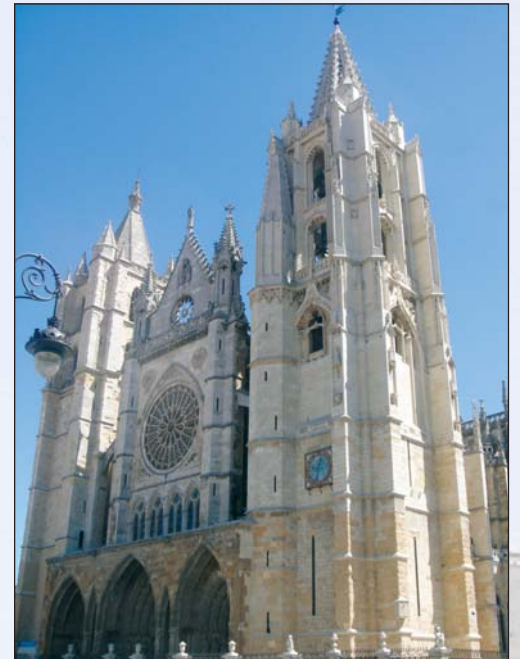
Catedral de León