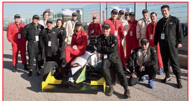
Reunión del Club Decision Makers de BravoSolution (circuito del Jarama de Madrid)