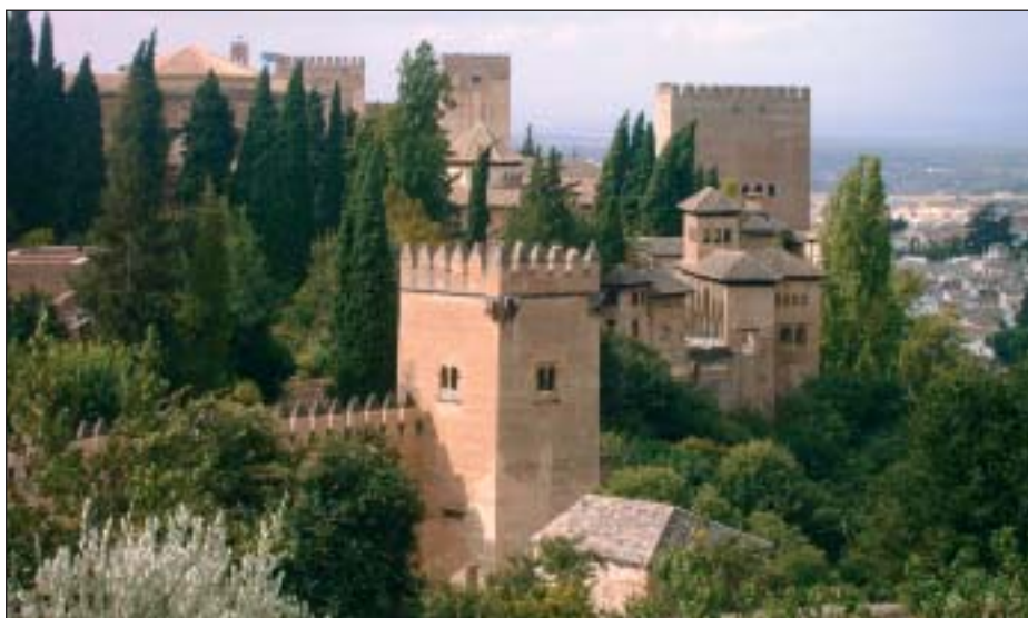
Granada, sede del 2º Congreso de "Modernización de los Servicios Públicos (10 y 11 mayo 2010)