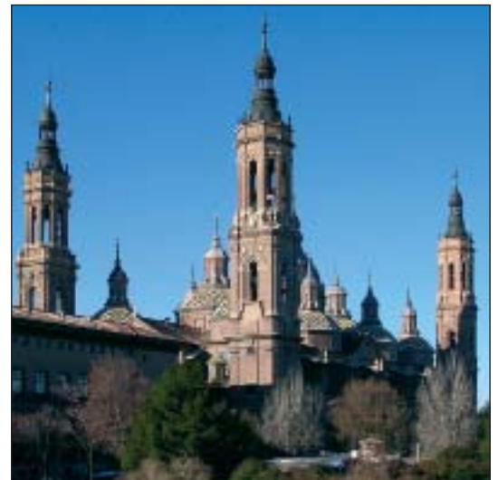
Zaragoza, sede de Tecnimap 2010 (6 a 9 abril 2010)