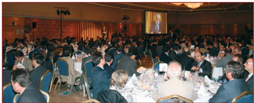
Cena de Gala de la 6ª Diada de les Telecomunicacions, donde nos entregaron el Diploma y Placa del COITT

número de noviembre ya no tendría sentido publicar... "a toro pasado". De hecho, puedo adelantarle que la "rueda de prensa oficial" de la Consejera con las novedades tendrá lugar el 3 de octubre: nuestra edición en Internet competirá pues en actualidad con los mismos "diarios" de prensa escrita, al liberar definitivamente todos los artículos de a+ , el 4 de octubre.