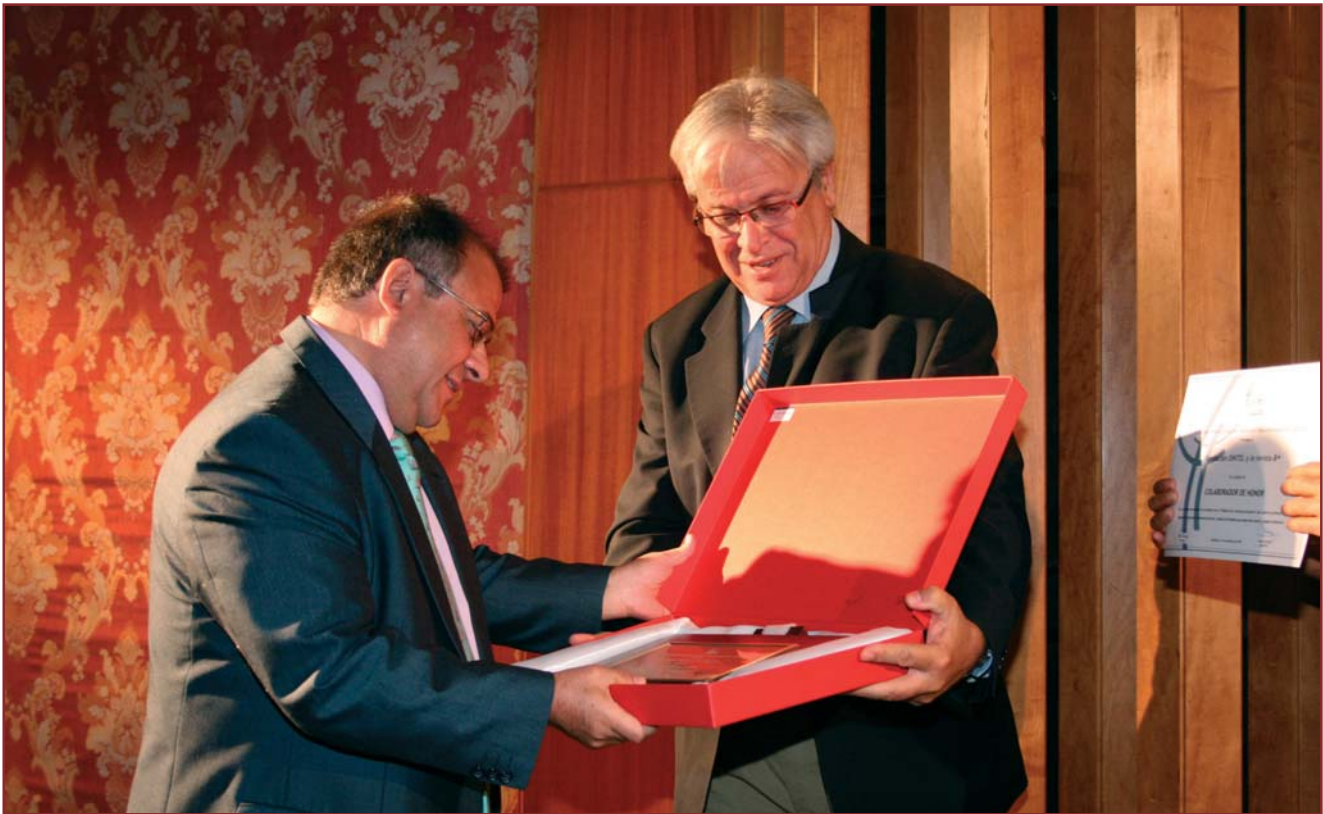
Entrega del Diploma y Placa del COITT, por el Ministro Clos, a la Fundación DINTEL y su Revista a+

este galardón que nos han concedido los Ingenieros Técnicos de Telecomunicación: ¡gracias!