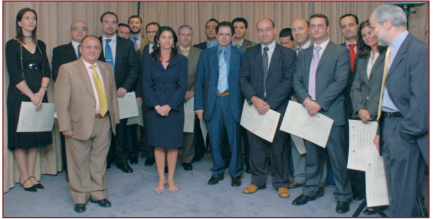
Promoción de Formación de CISAs, de junio 2007