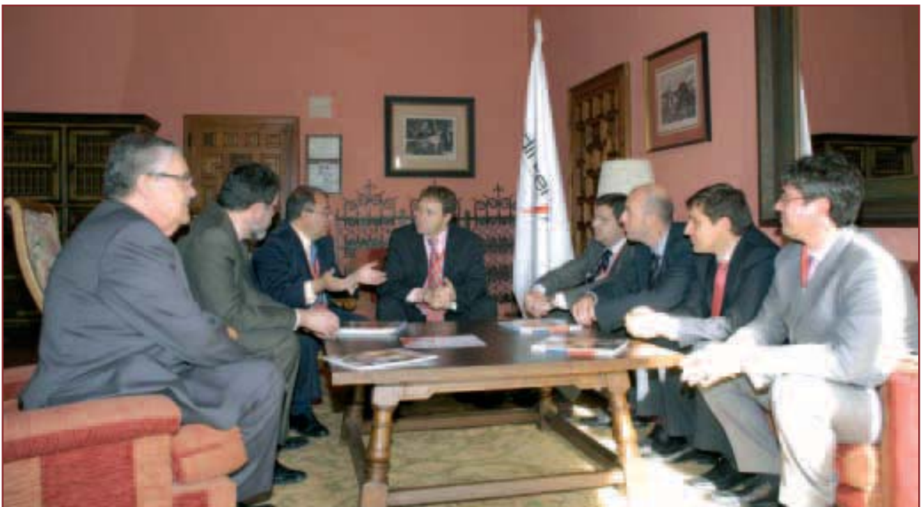
Entrevista durante ENISE, en la suite de reuniones de DINTEL, en el Parador de San Marcos, con líderes de la Industria de la Seguridad en Castilla y León