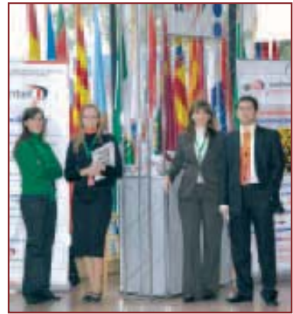
Stand de la Revista a+ en TECNIMAP 2007

Sé que muchos no estarán de acuerdo con esta valoración global ... es, por ello, que hemos organizado en Madrid una Velada DINTEL de clausura de las actividades DINTEL del 2007 para el martes 18 de diciembre sobre " TECNIMAP 200X ": debatiremos sobre lo que ha sido TECNIMAP 2007 y sobre lo que podría ser TECNIMAP 2008/2009. Informaremos de todo ello