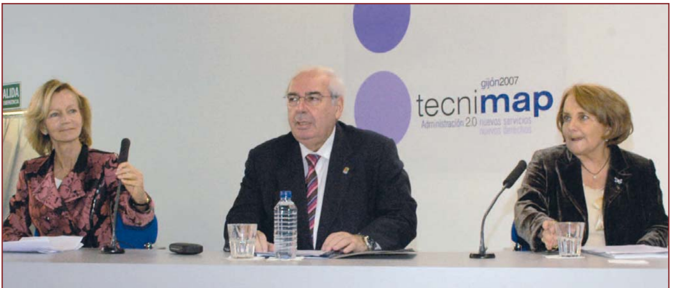
Sesión Inaugural: Ministra D a . Elena Salgado, Presidente del Principado de Asturias D. Vicente Alberto Álvarez Areces y, Alcaldesa de Gijón D a . Paz Fernández Felgueroso (de izquierda a derecha)

■ el Ayuntamiento de Gijón se volcó en los aspectos logísticos, que funcionaron a la perfección. ■ la zona de stands, en especial el pabellón 5, fue un auténtico "meeting point" para los participantes, que además encontraban distribuidos por