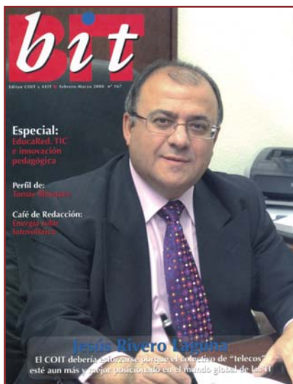
Portada de la Revista del Colegio Oficial y Asociación Española de Ingenieros de Telecomunicación

Premios Salvá y Campillo que se entregan durante la misma.