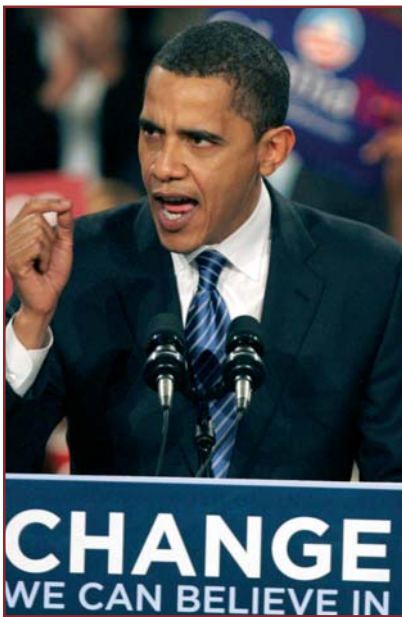
Barack Obama, entonces Candidato a la Presidencia de EE.UU., en un acto electoral de su campaña

En definitiva, y como le decía más arriba, estoy convencido de que ceñir la convergencia de seguridades , a la convergencia de la seguridad física y lógica, es restringir excesivamente la