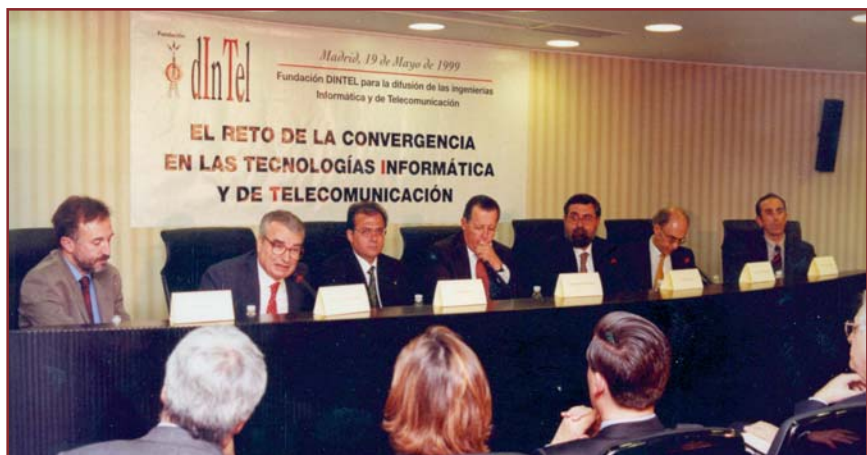
Acto de Presentación pública de Fundación DINTEL, el 19 de mayo de 1999, bajo la Presidencia de S.A.R. don Carlos de Borbón, Infante de España

Ciertamente la " Seguridad Pública ", o la " Seguridad Interior ", como la llamaba el Presidente Barack Obama en su programa político, exige en primer lugar el establecimiento de estrategias globales (lucha contra el terrorismo