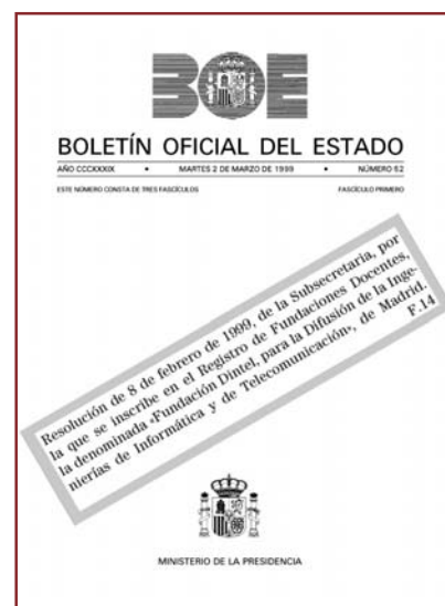
Portada del BOE de 2 de marzo de 1999, en el que se inscribe a DINTEL en el Registro de Fundaciones Docentes y de Investigación

Algunas grandes empresas, empiezan a ofrecer servicios globales