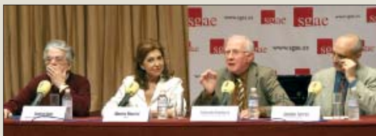
Presentación de su "Suite Iberia", en la Sociedad General de Autores