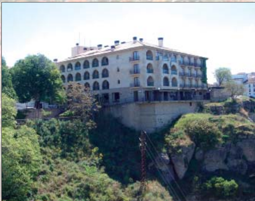
Parador de Ronda