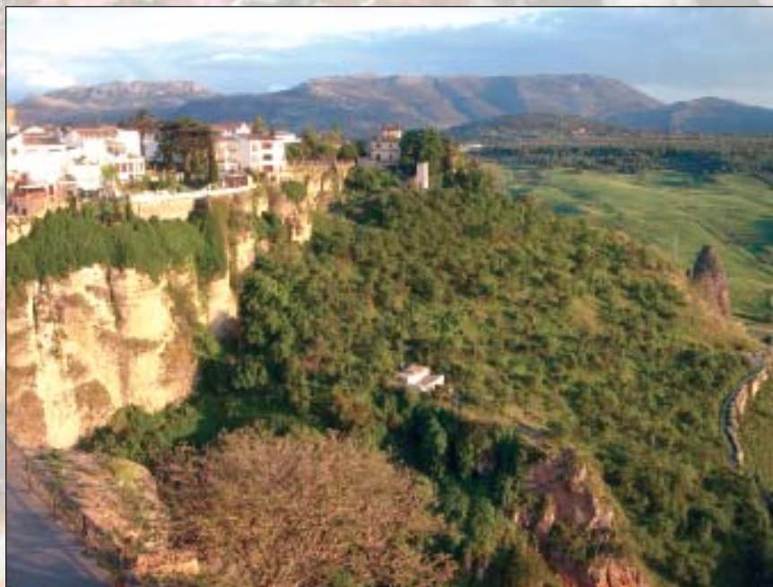
Vista desde el Parador de Ronda

Tantas cosas que ver, tantos paisajes en los que dejarse cautivar, que por no olvidar ninguno mejor no citar algunos. Eso sí, al menos, extasiéase algunos segundos -le parecerán horas-, llenando sus ojos con el "Tajo de Ronda" de su Río Guadalerín.