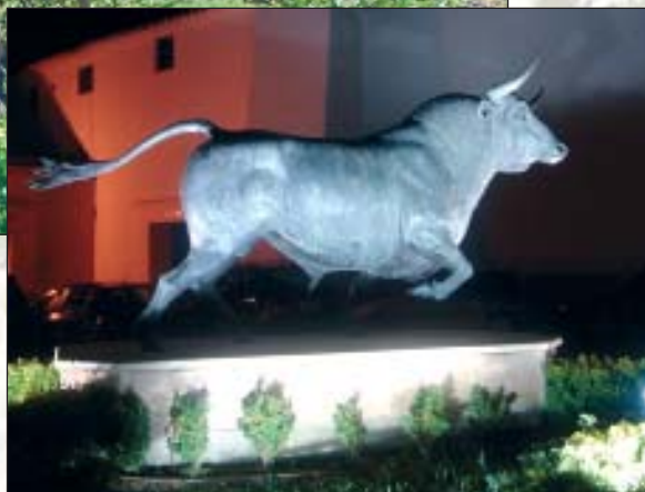
Bronce, a la espalda de la Plaza de Toros de Ronda

Es el homenaje mínimo que se le debe a esta tierra de toreros: Pedro Romero (nacido en Ronda en 1755) y su "dinastía", así como la de los